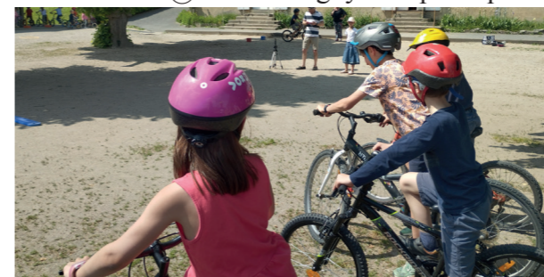
Les enfants s'entraînent pour le Tour de France

Souvignyssoises, Souvignyssois si vous avez des idées pour animer cet après-midi, n'hésitez pas à écrire à l'adresse mail tourdefrance@ville-souvigny.com pour que ce jour soit une réussite.